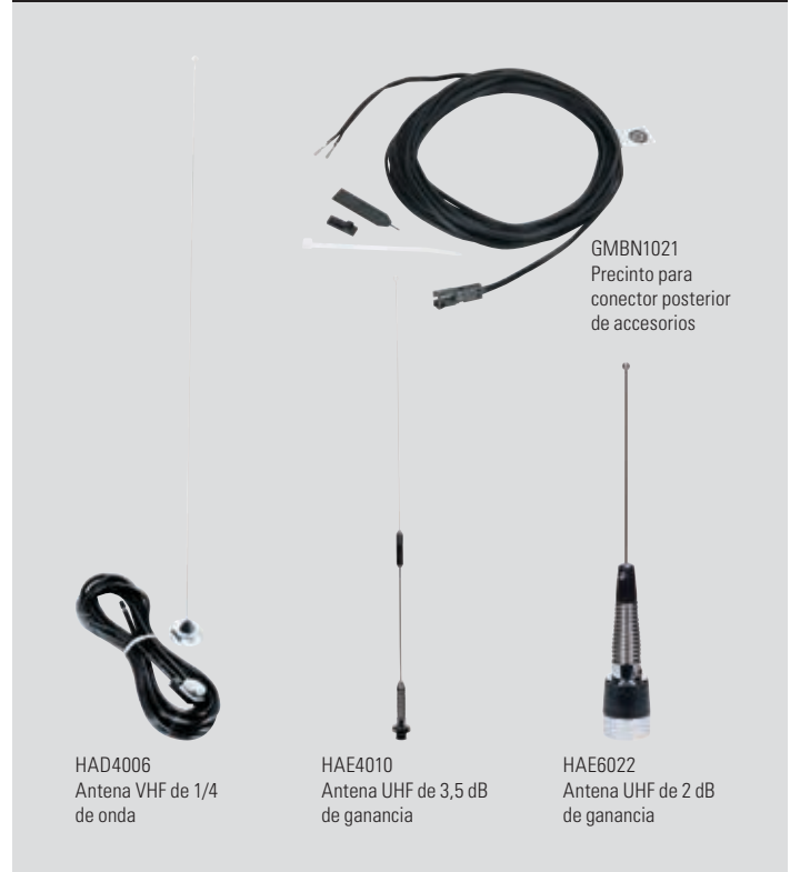
HAD4006 Antena VHF de 1/4 de onda