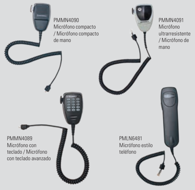
PMMN4090 Micrófono compacto / Micrófono compacto de mano